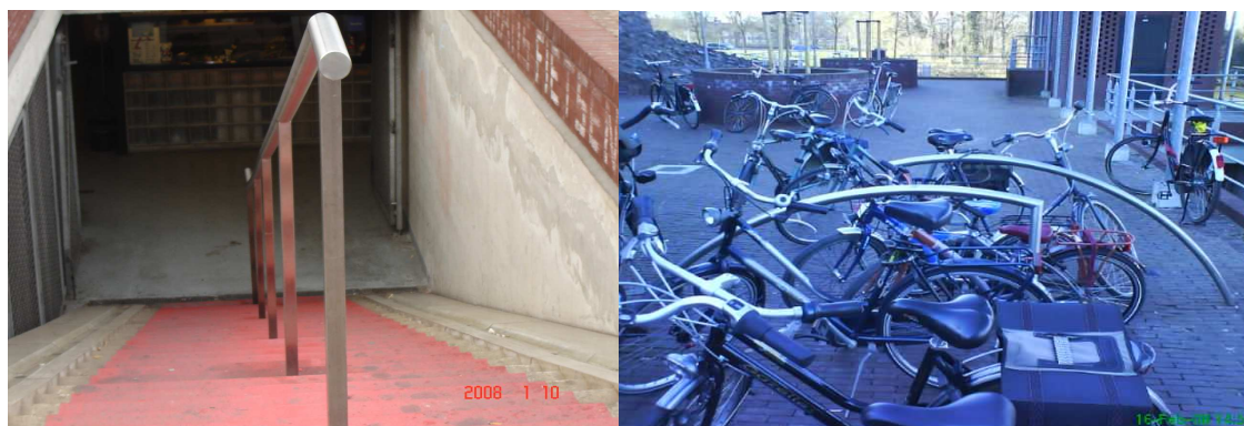
Fietsenstalling bij het Maagjesbolwerk

In Zwolle is ervoor gekozen om het parkeren van fietsen op drie plaatsen in de binnenstad te concentreren. Er zijn drie gratis bewaakte fietsstallingen. De locaties zijn het Meerminneplein, de Pletterstraat en bij het Maagjesbolwerk.