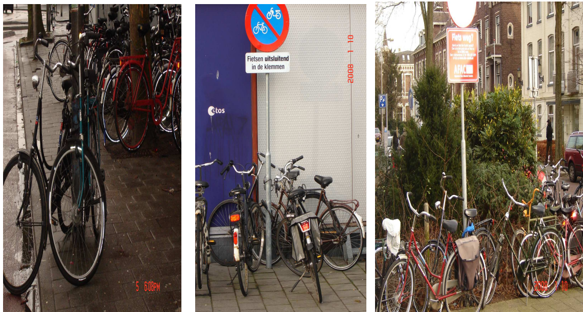
Locatie busstation ter hoogte Wester- en Oosterlaan